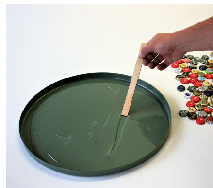
Fig. 4 De epoxy wordt met een spatel over het blad verdeeld.