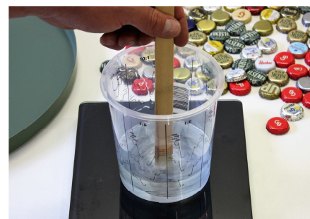
Fig. 3 De A en B component worden (in de juiste verhouding) goed gemengd.