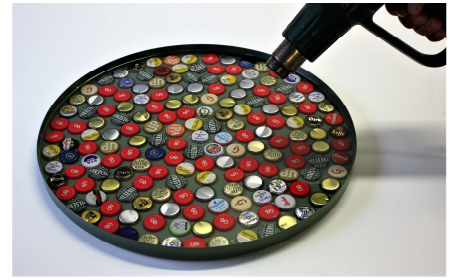
Fig. 7 Eventuele luchtbelletjes worden met een föhn verwijderd.