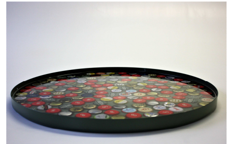
Fig. 8 Het blad, zonder luchtbelletjes, voor 48 uur met rust gelaten