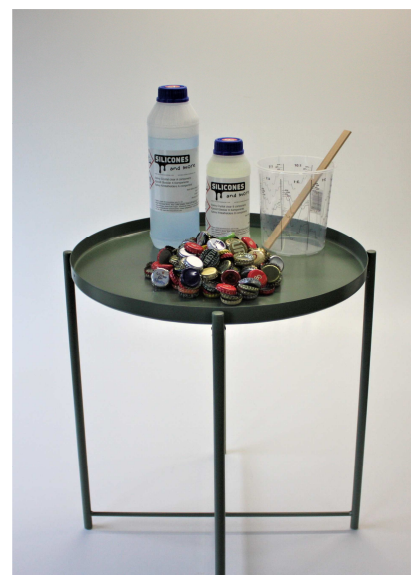
Fig. 1 Alle producten worden klaargezet. Inclusief het tafeltje.