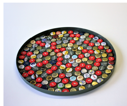
Fig. 5 De doppen zijn (enigszins) gelijkmatig over het blad verdeeld. Nu is het wachten geblazen.