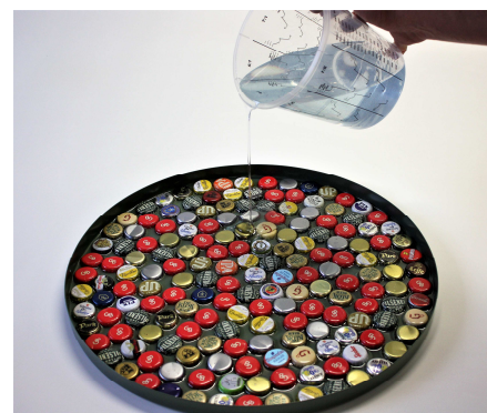
Fig. 6 De epoxy wordt met een dunne straal in het midden gegoten.